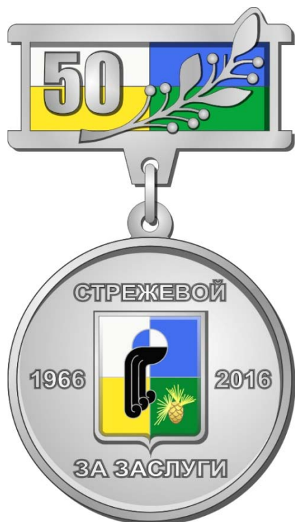
Рисунок юбилейного нагрудного знака «За заслуги перед городом Стрежевым»