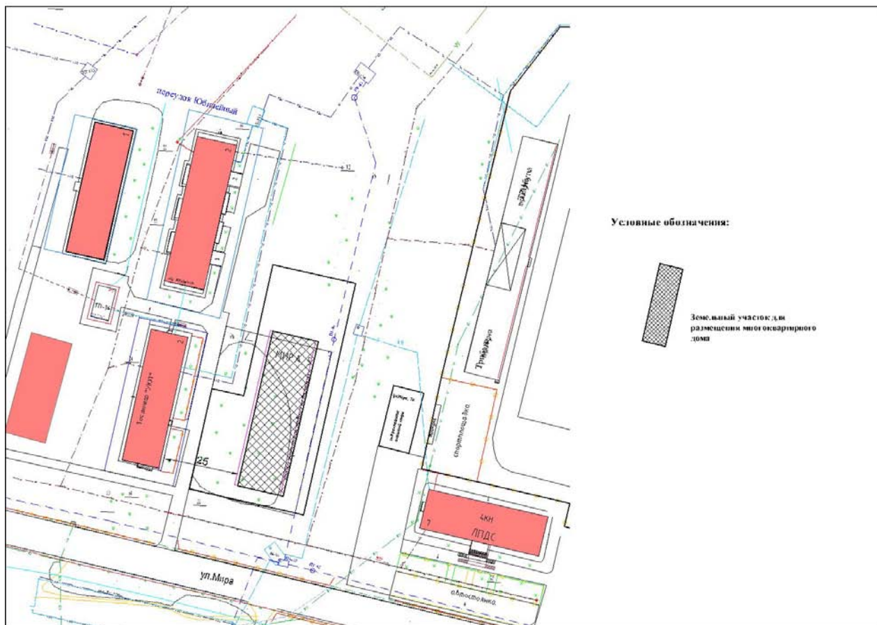
Схема размещения дома

Однокомнатные – 12 шт., Двухкомнатные – 12 шт., Трехкомнатные – 8 шт.