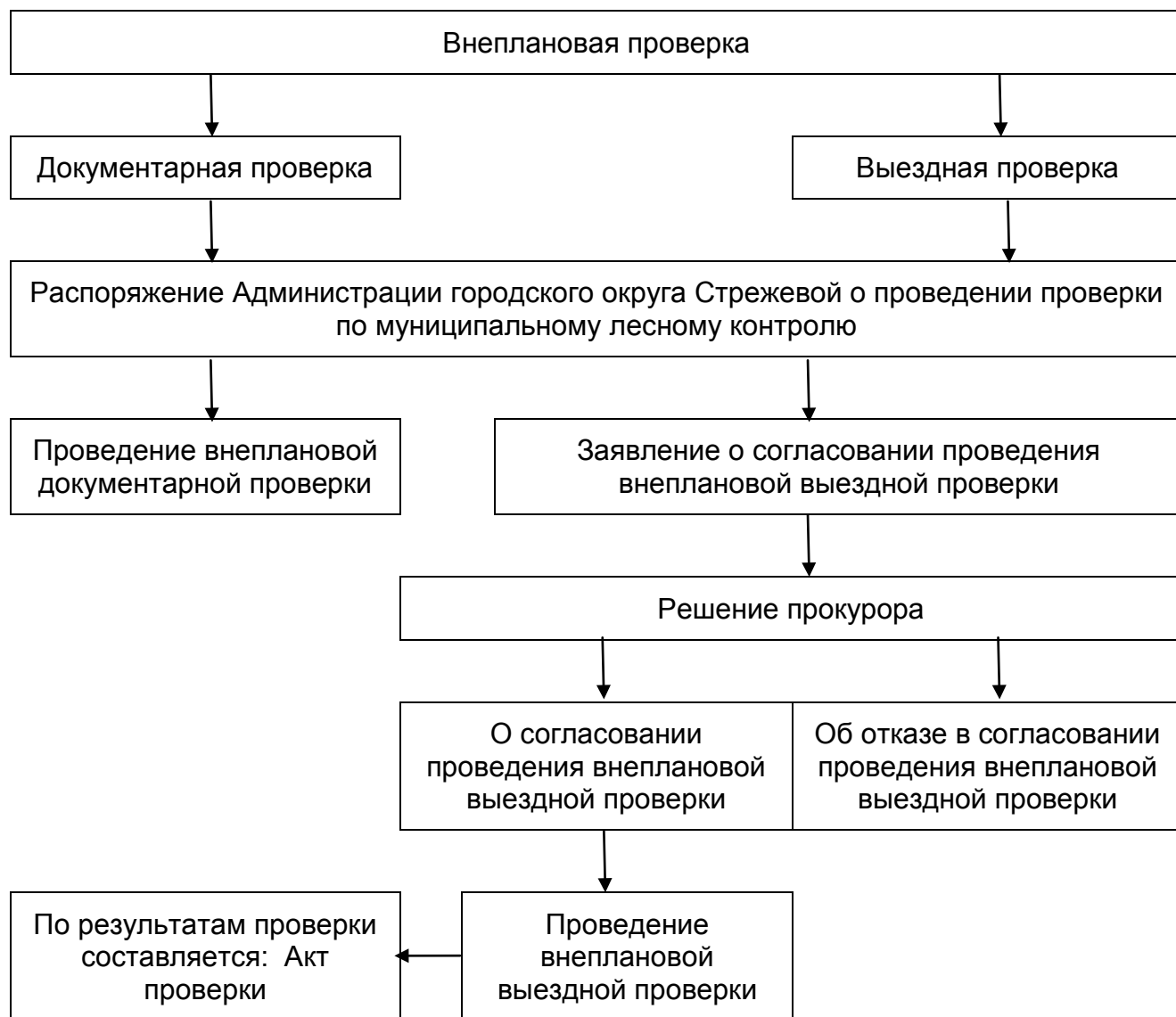
Блок - схема последовательности действий осуществления муниципального контроля