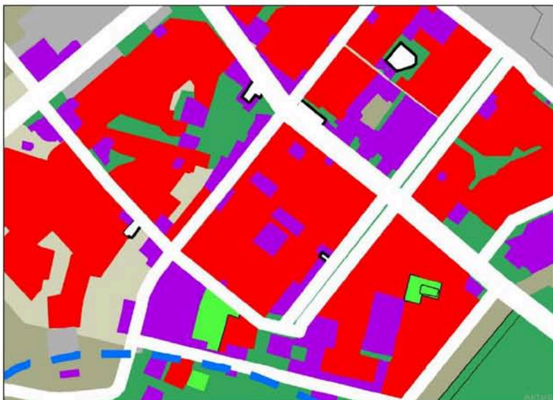
Фрагмент карт Генерального плана (существующее положение)