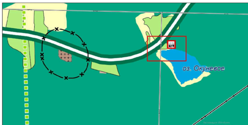
Фрагмент карт Генерального плана (существующее положение)